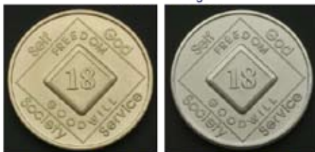
Acabado en bronce