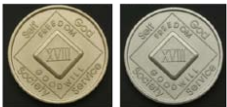
Acabado en bronce